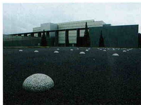
下の池周り車回し横にある駐車帯の石の鉄も四国牟礼和泉屋作。こういったさりげない部分のディテールにも、アートのな表情