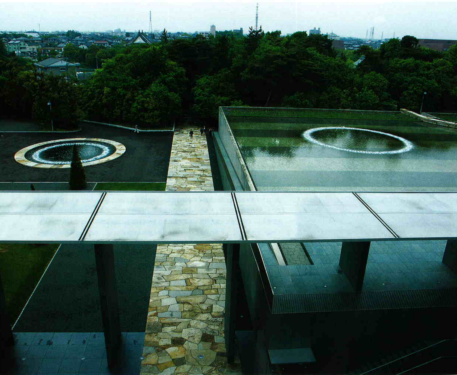
建物屋上より、正面アプローチ石畳を中心に上の池と下の池を望む。力強い石畳は四国牟礼和泉屋作、城址公園の緑と新しい建築を結び、幅は5,750mm。厚い石の仕上げや目地合わせの精度を、新旧部分で徐々に変化させている。普段良く使う部分にこそ、アートのなゼスチャーが必要との考え